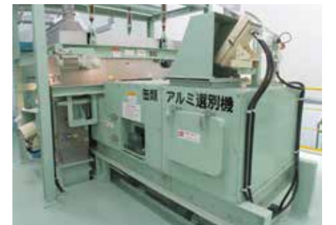
缶類アルミ選別機