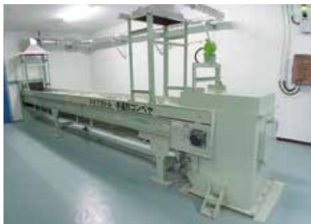
PETボトル手選別コンベヤ