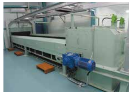
プラ容器手選別コンベヤ