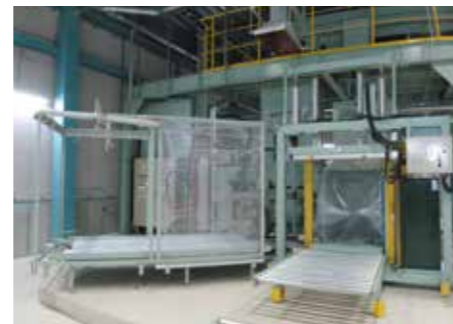
プラ容器圧縮梱包機