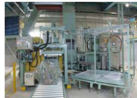
その他プラ類圧縮梱包機